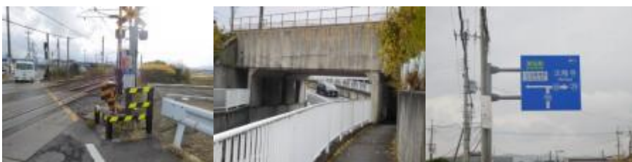
※安堵踏切、JR線下潜る、法隆寺駅・法隆寺への標識

③この駅から少し行った先の小泉口交差点（13時47分）で、鉄道の方向を見失い不安となる。これまでの第六感で進む。車から降りた営業マンの方に「法隆寺への道筋」をお伺いするが、「私はこの界隈は不案内でわかりません。」との回答があり。その回答を得た後、左手にJR線の電車が通過するのを見届け、ホットする。13時59分、安堵踏切を横切り、鉄道の左側を歩く。14時21分、JR線を潜り、鉄道の右側となる。14時24分、万歩計で67歩ある安富橋（とみお川）を渡る。その先で安堵町から斑鳩（いかるが）町となる。14時28分、東洋シール工業があった。法隆寺と法隆寺駅と記した道路標識がある交差点を左折する。14時43分、興留踏切を横切った先に法隆寺駅（14時45分）があった。漢字版の時計が印象的であった。