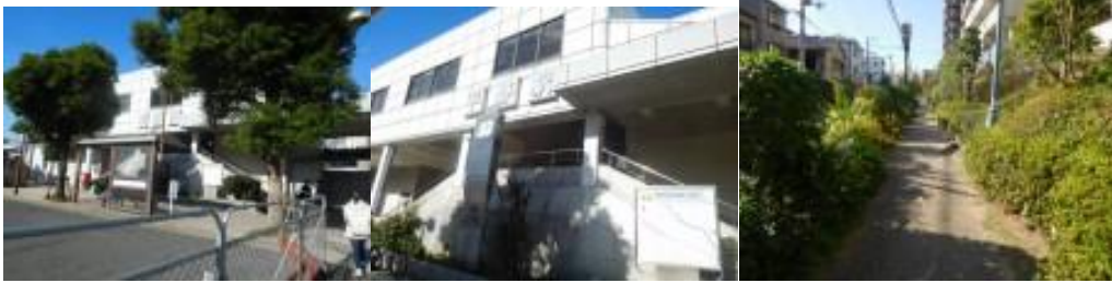
※平野駅、東部市場前駅への路