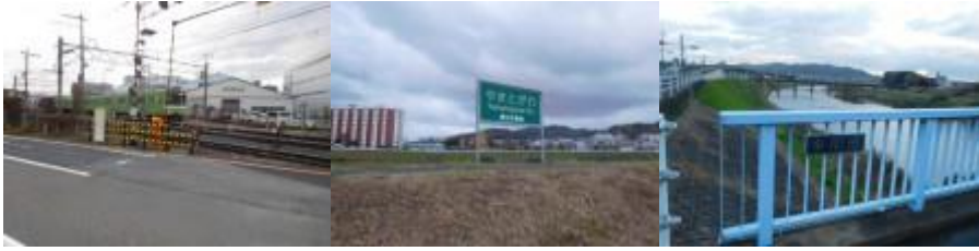
※JR 線踏切（この踏切を渡るべきだった）、多聞橋（たもん）