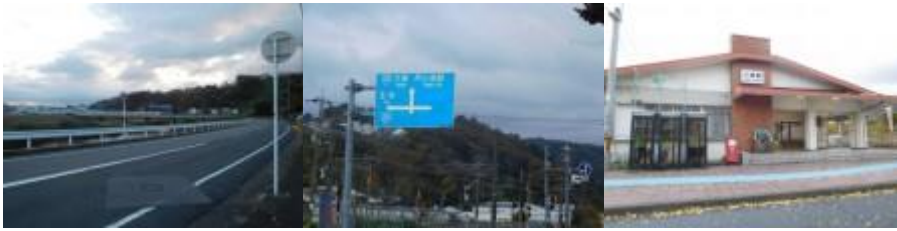
※大和川のため大きく迂回、王寺駅と三郷駅、三郷駅