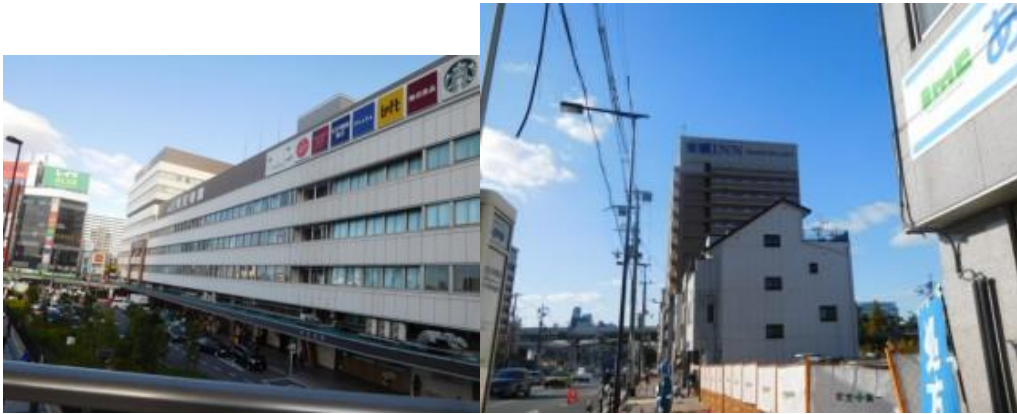
※天王寺駅、東横イン