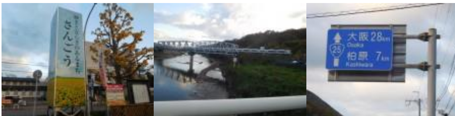
※三郷駅、大正橋、大阪 28 km ・ 柏原 7 km

②この駅から河内堅上駅そして高井田駅にかけて紅葉が見頃な山間を歩く。7時18分、214歩ある大正橋（大和川）を渡る。7時23分、大阪28km、柏原7kmと記した道路標識前を通過。7時23分頃から本格的な山歩きとなる。左手には大和川があった。