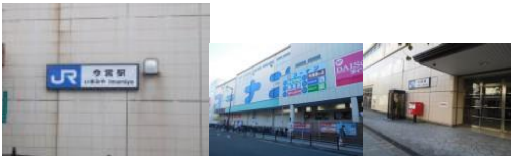
※今宮駅、駅に面してコーナン

⑨ここから JR 難波駅への踏破が活字の難が付くように大変であった。何人もの方に聞いて、1.3 kmの区間を 49 分要してやっと 16 時 1 分到着する。難波駅は南海高野線や近鉄奈良線の踏破の際、立ち寄った駅舎にも関わらず、こんなに苦労するとは。改めて仕上げの難しさを教えてもらったような瞬間であった。JR 難波駅前で関西本線踏破の瞬間の記念写真を通行人の方に撮って頂く。感動・感激で一杯となる。