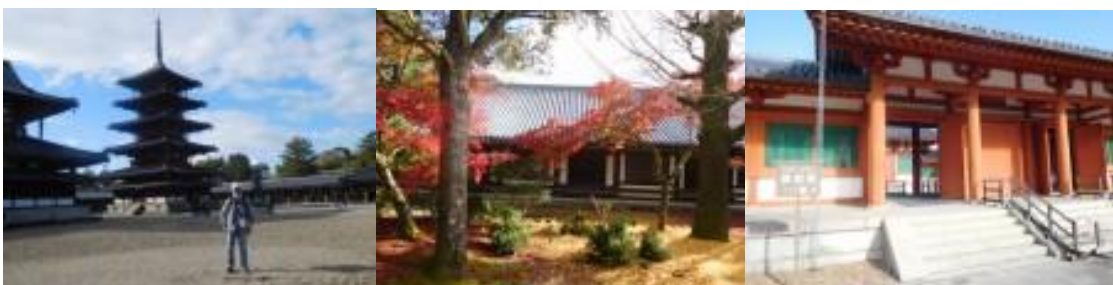
※五重塔、見事な紅葉、東院伽藍前

法隆寺観光は、これまで3度来たことがあるが、何度来てもいいものだ。拝観料を1500円納め、法隆寺境内図を見ながら1時間強、西院伽藍、大宝蔵院、東院伽藍と有