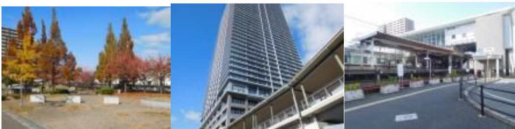
※龍華町東公園、八尾市立病院、久宝寺駅

⑥11時35分、龍華町東公園前を通過。11時41分、高層ビルである八尾市立病院前を通過。これまでの旅を通じて、このような病院の超高層ビルとの対面は初めてなので驚いた。11時48分、快速停車駅の久宝寺駅に到着。ここから加美駅への道筋は、廃線となったと思われる近鉄線路に惑わされ、路に迷うというウォーキングの醍醐味を堪能する。20分位メイクドラマとなる。数人の方に聞いてやっと加美駅（12時41分）に到着することができる。松原踏切を横切った先にあった。残念ながら今でもどの道筋を歩いたのか再現できない状況である。