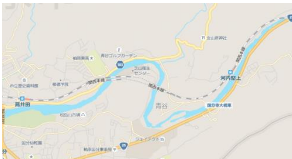
※河内堅上駅～高井田駅

③自転車管理の方に「駅前の道筋から高井田駅に行けるか否か」をお伺いする。「山道を通り抜ければ行けます。」との回答を得て、くぬくねした民家の路地を進む。一時は引き返し国道25号線に戻っての踏破も考えた。ここでも、ややこしい道筋で運よく地元の人と対面しピンチを凌ぐ。「高井田駅は山の向こうにある。山を下ると幹線道路に出る。右折した先で府道183号線に合流する。その道路を直進したら行けるよ。」と教