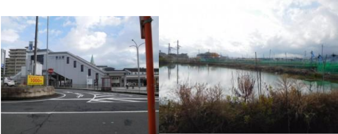
※大和郡山駅、金魚養殖のため池

②大和郡山市は金魚の養殖が盛んということで、鉄道沿線至る所でため池（後述の徳島出身の方から教えて頂く）があった。12時40分、前方に数年前に踏破した近鉄橿原線があった。この境界は数年前筒井駅から近鉄郡山駅の踏破の際立ち寄った区間で懐かしくなったが、橿原線越えに苦勞する。12時48分、JR本庄踏切まで戻り、JR線に沿って歩く。少し雨模様となり、傘を取り出すと同時にリュックに黄色い雨具をかける。その配慮も無駄となり、数分で雨があがる。