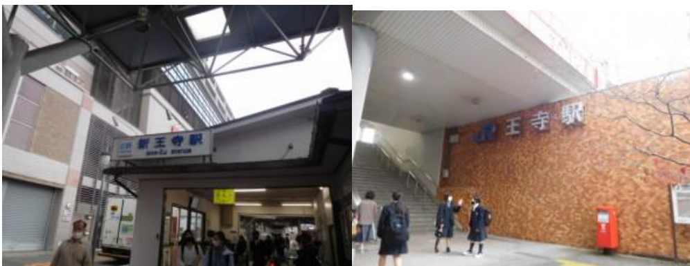
※新王寺駅（近鉄線）、JR王寺駅

15時27分、雀の群れに遭遇する。15時37分、万歩計で60歩ある竜田川を渡る。15時41分、見覚えのある大和川（昭和橋：213歩）を渡る。橋の途中で王寺町に入る看板を目にする。この橋を渡った先でJR王寺駅の案内板を目にする。そして、暫く歩いた先にJR王寺駅（16時5分）があった。この駅は近鉄田原本線の新王寺駅が面していた。近鉄新王寺駅は数年前家内と旅行する際、橿原神宮から法隆寺に移動する時、利用した駅なので懐かしくなった。また、JR王寺駅も新大阪駅へのアクセスで。