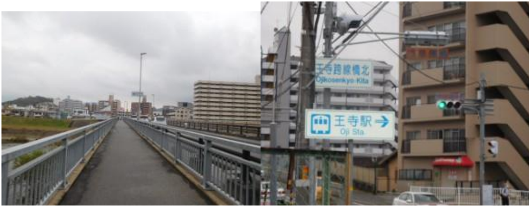
※昭和橋、王寺駅への案内板

15時27分、雀の群れに遭遇する。15時37分、万歩計で60歩ある竜田川を渡る。15時41分、見覚えのある大和川（昭和橋：213歩）を渡る。橋の途中で王寺町に入る看板を目にする。この橋を渡った先でJR王寺駅の案内板を目にする。そして、暫く歩いた先にJR王寺駅（16時5分）があった。この駅は近鉄田原本線の新王寺駅が面していた。近鉄新王寺駅は数年前家内と旅行する際、橿原神宮から法隆寺に移動する時、利用した駅なので懐かしくなった。また、JR王寺駅も新大阪駅へのアクセスで。