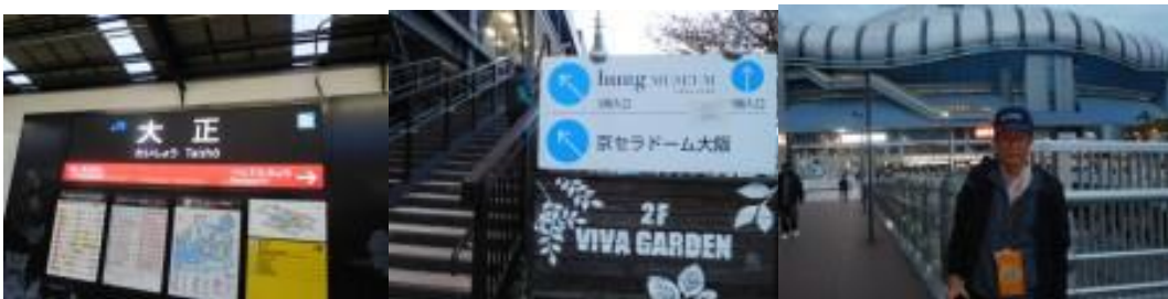
※大正橋駅、京セラドーム大阪