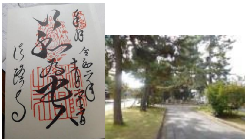
※法隆寺の御朱印、法隆寺参道

途中、鏡池前にある東宝聖霊院に立ち寄って法隆寺の御朱印を頂く。これで集印帖にある御朱印は平等院鳳凰堂（令和2年3月24日）、出雲大社（令和2年8月5日）、法隆寺（令和2年11月23日）となった。御朱印集めも、今後の歩き鉄旅で楽しみの一つになりそうである。