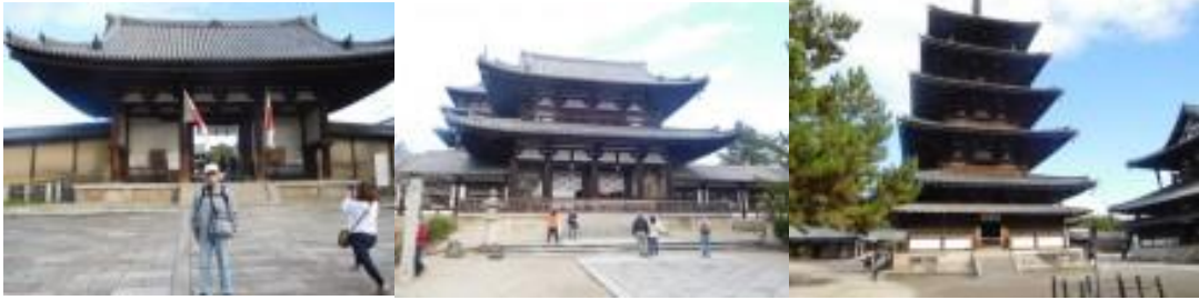
※法隆寺南大門前、大講堂、五重塔