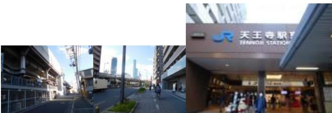
※東部市場前駅界限、近鉄の高層ビル、天王寺駅

⑧ここからは、10年前に踏破した大阪環状線と反対回り（時計回り）で、新今宮駅、今宮駅を目指す。天王寺駅と新今宮駅の間で昨夜から宿泊している東横インあべの天王寺があった。見覚えのある新今宮駅には14時45分到着。近くには阪堺電車の新今宮駅があった。南海電鉄の線路を経由し、今宮駅を目指す。14時55分、JR線を潜る。早めに潜ったため、10分位大回りとなる。今宮駅には15時12分到着。