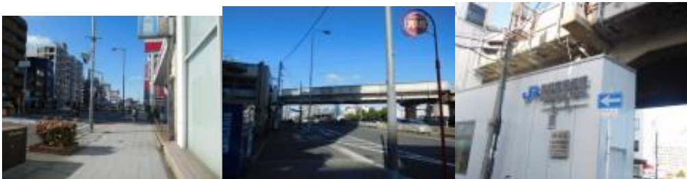
※東部市場前駅への路、東部市場前駅

⑧ここからは、10年前に踏破した大阪環状線と反対回り（時計回り）で、新今宮駅、今宮駅を目指す。天王寺駅と新今宮駅の間で昨夜から宿泊している東横インあべの天王寺があった。見覚えのある新今宮駅には14時45分到着。近くには阪堺電車の新今宮駅があった。南海電鉄の線路を経由し、今宮駅を目指す。14時55分、JR線を潜る。早めに潜ったため、10分位大回りとなる。今宮駅には15時12分到着。