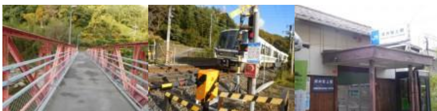
※弁天橋、青谷踏切、河内堅上駅

7時43分、奈良県王寺町から大阪府柏原市となる。その先でJR線を潜り、鉄道の左側となる。JR線は大和川を越えた山間とポジションを変える。これまでの第六感が働き、赤い弁天橋（歩道橋）が見えてきたので、そろそろ河内堅上駅ではないかとナビを検索する。橋を渡った先に河内堅上駅があった。8時、確認のため、橋を通行している人に「河内堅上駅の道筋」をお伺いする。「この橋を渡り、青谷踏切を横切って暫く歩いた先に駅があります。」と教えて頂く。この橋を渡らないと、大きく迂回しない限り、大和川を橋はなかった。それ故、ラッキーであった。河内堅上駅（8時10分）は大和川に沿ってあり、駅舎近くの山々は紅葉が見頃である。