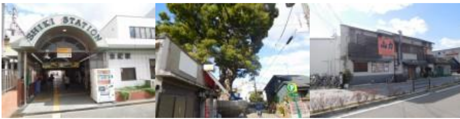
※志紀駅、路地から路地、山力