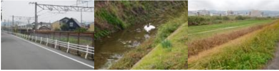
※法隆寺駅界限、白鷺と鴨、王寺駅への路