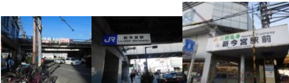
※新今宮駅、阪堺電車の新今宮駅