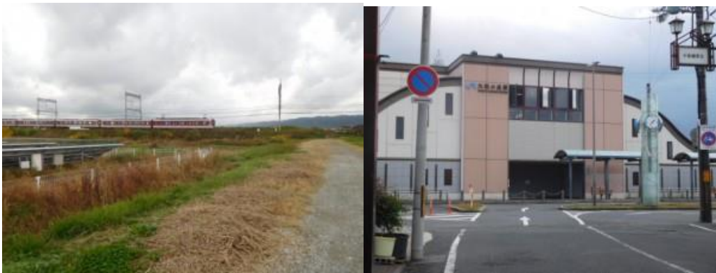
※前方に近鉄線、大和小泉駅

②大和郡山市は金魚の養殖が盛んということで、鉄道沿線至る所でため池（後述の徳島出身の方から教えて頂く）があった。12時40分、前方に数年前に踏破した近鉄橿原線があった。この境界は数年前筒井駅から近鉄郡山駅の踏破の際立ち寄った区間で懐かしくなったが、橿原線越えに苦勞する。12時48分、JR本庄踏切まで戻り、JR線に沿って歩く。少し雨模様となり、傘を取り出すと同時にリュックに黄色い雨具をかける。その配慮も無駄となり、数分で雨があがる。