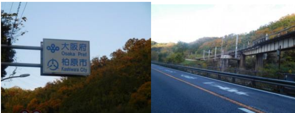
※大阪府柏原市へ、JR線下を潜る

②この駅から河内堅上駅そして高井田駅にかけて紅葉が見頃な山間を歩く。7時18分、214歩ある大正橋（大和川）を渡る。7時23分、大阪28km、柏原7kmと記した道路標識前を通過。7時23分頃から本格的な山歩きとなる。左手には大和川があった。