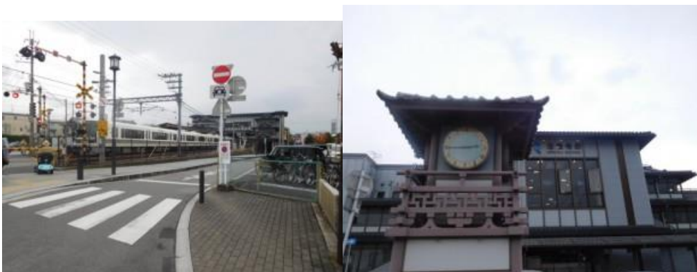
※興留踏切、法隆寺駅

④15時4分、鴨や白鷺がいる川に沿って歩いた先で、JR線にぶつかり行き止まりとなる。15時7分、橋の袂まで引き返し、橋を渡る。15時10分、斑鳩町立斑鳩南中学校があった。鉄道を大きく離れ暫く歩く。15時18分、西目安踏切を横切って鉄道の右側となる。この界隈で気にならない程度の小雨に遭遇するが、暫く歩くと回復する。